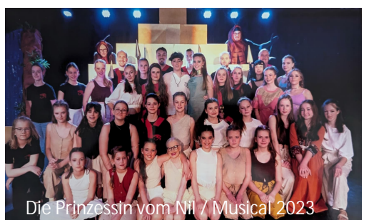
Die Prinzessin vom Nil / Musical 2023

Ebbelicher Weg 19, 45699 Herten Tel: 02366/50082-0, Fax: 02366/50082-20 e-Mail: eks-rs@bistum-muenster.de www.eks-herten.com