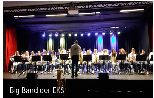
Big Band der EKS