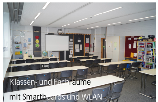
Klassen- und Fachräume mit Smartboards und WLAN